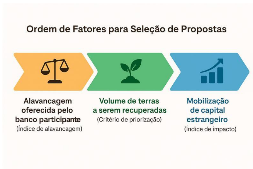
FIGURA 1 – ORDEM DE FATORES PARA SELEÇÃO DE PROPOSTAS

Quais documentos as instituições financeiras elegíveis deverão apresentar para participar dos leilões?