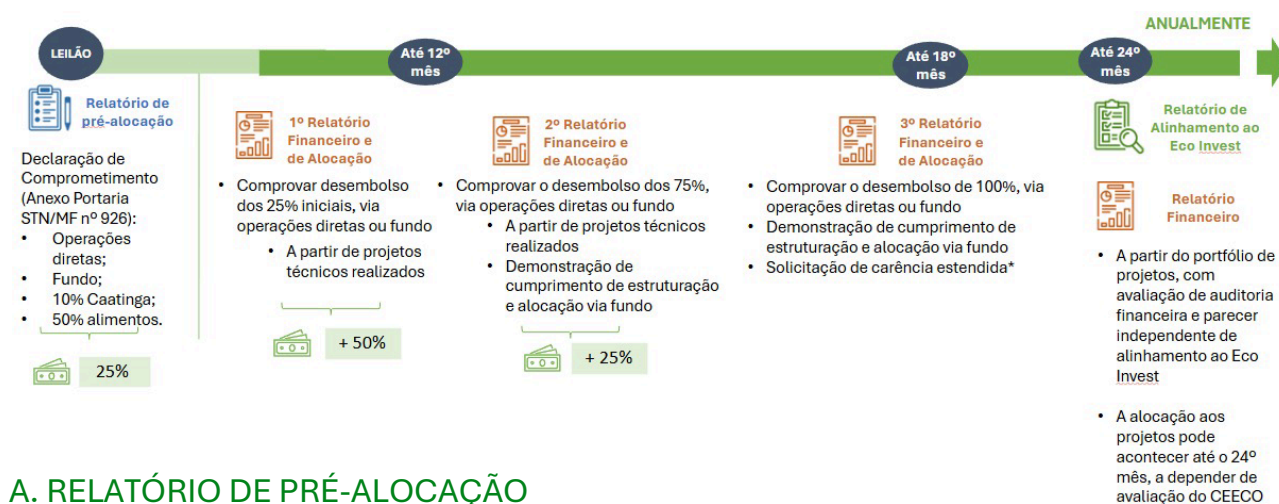
FIGURA 2 – FLUXO E CRONOGRAMA DE ENTREGA DE RELATÓRIOS

As exigências específicas de cada relatório estão descritas nas seções seguintes deste Capítulo. A Figura 2 apresenta um resumo visual do fluxo e dos prazos de entrega dos relatórios.